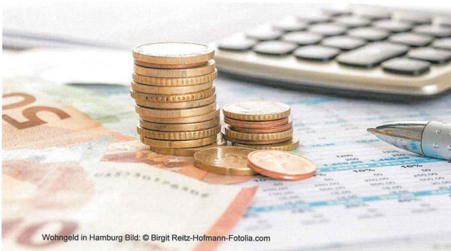
Wohngeld in Hamburg