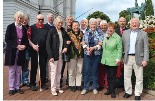
Gestaltung: www.CL-Konzept-Design.de | Redaktion: Jörn Meve

Kartenvorverkauf: Karten-Vorbestellungen unter 040/ 317 909 23 oder am 12.09. am BSB-Stand im Kollegiensaal im Rathaus Altona; Restkarten am Schiff.