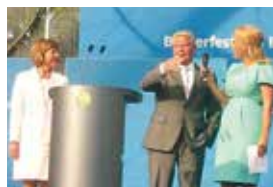
Eröffnung des Bürgerfestes durch Joachim Gauck und Daniela Schadt.